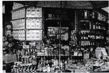
Bunuri variate pentru preferințe variate

Parcursirea acestei teme și rezolvarea testelor de autoevaluare de la sfârșitul ei vă vor asigura competențe care vă vor permite: